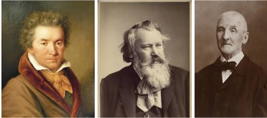
Beethoven, Brahms i Bruckner, 3 de les 4 grans B germàniques. Tots ells fadrins vitalicis.