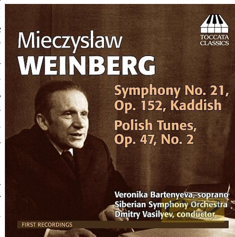
Nou enregistrament del redescobert M. Weinberg.

Rescatam avui alguns plats oblidats de la gastronomia sonada amb alguns trucs senzills per reivindicar el receptari arraconat. Recatalogam allò que prèviament havíem descatalogat.